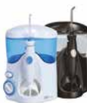
Waterpik® Ultra WP-100 CN 257206.5 Negro mate CN 174498.2