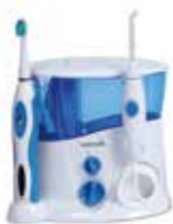
Waterpik® Complete Care WP-900 CN 163861.8

Conoce toda la gama de Waterpik® y las últimas innovaciones en: www.dentaid.es/waterpik