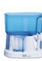
Waterpik® Clásico WP-70 CN 341784.6